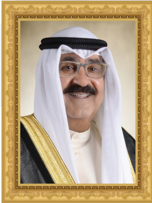
سمو الشيخ مشعل الأمد الجابر الصباح ولي عهد دولة الكويت