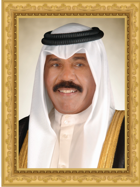
حضرة صاحب السمو الشيخ نواف الأمد الجابر الصباح أمير دولة الكويت